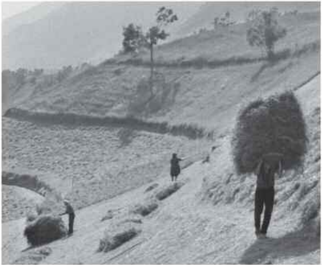
Rendre la foie à des hommes à Pats, maison Capre.