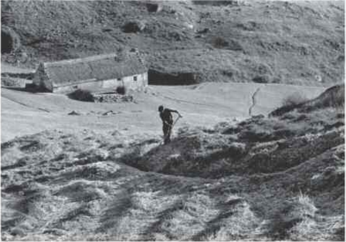
Faucher dans les prés et boucher des vigales dans la propriété Pélut à Saugrot