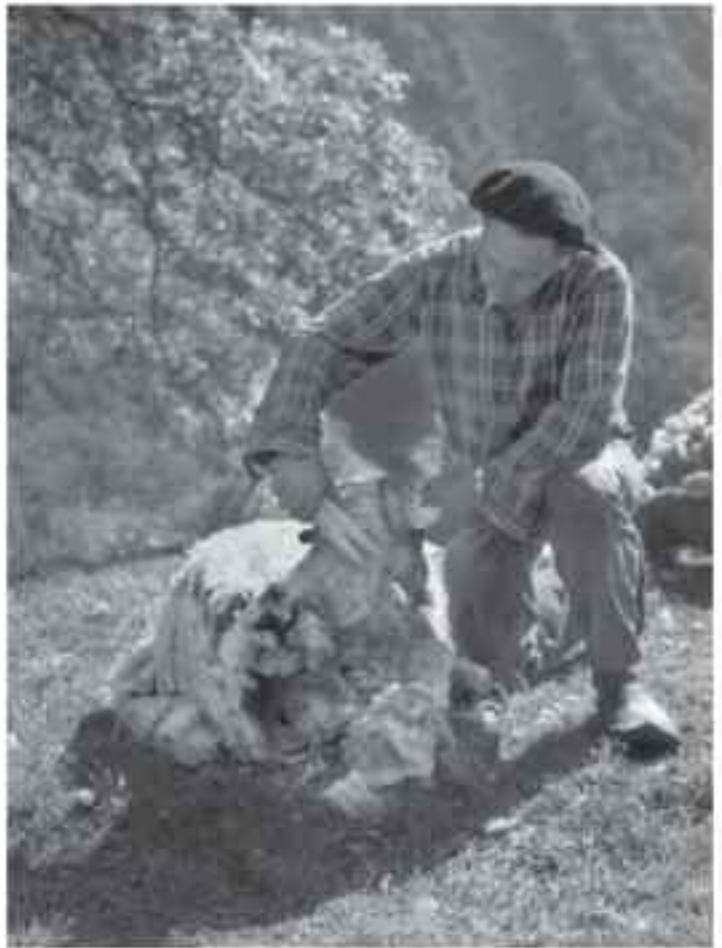
Trou de lavage, au sud de Comminges, Six.