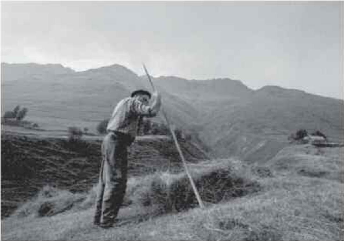
Souffler avant de poursuivre le labour à Pétis sous le Bassin d'Ourdegoose