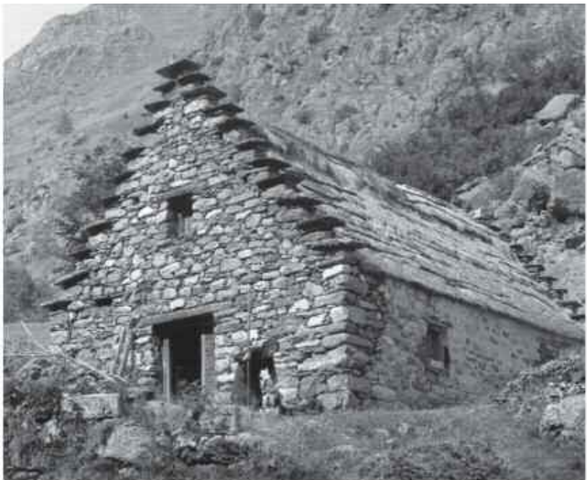
Grange de Souveron, maison Abriants IIIe