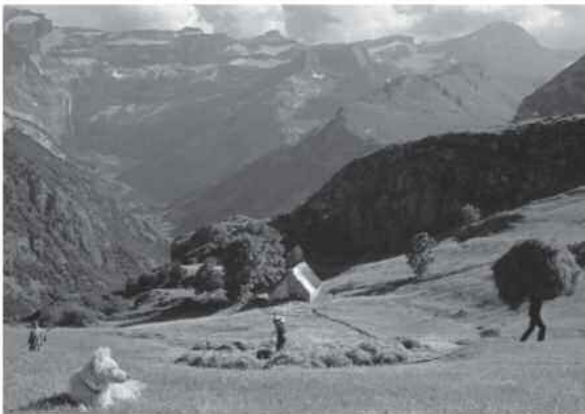
Remonter la pente : chez Rancoussidou, la grande « et en haut des pot