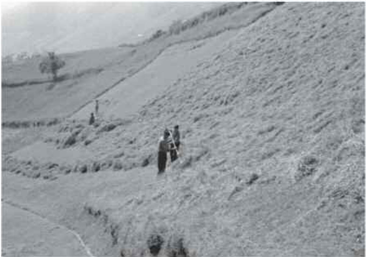
Faire des andains en emmenant l'herbe, le plus possible