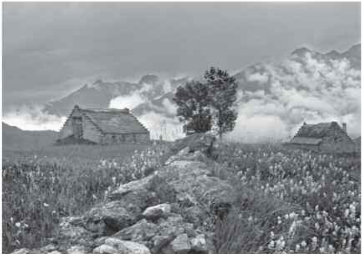
Abriants & Sauphot